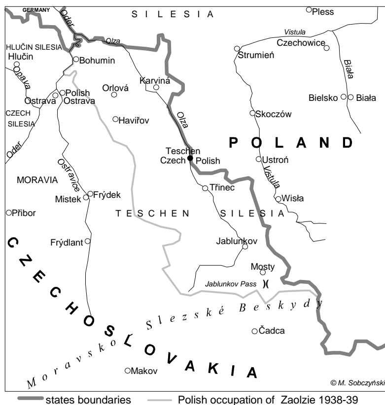
Śląsk Cieszyński w latach 1920-1939